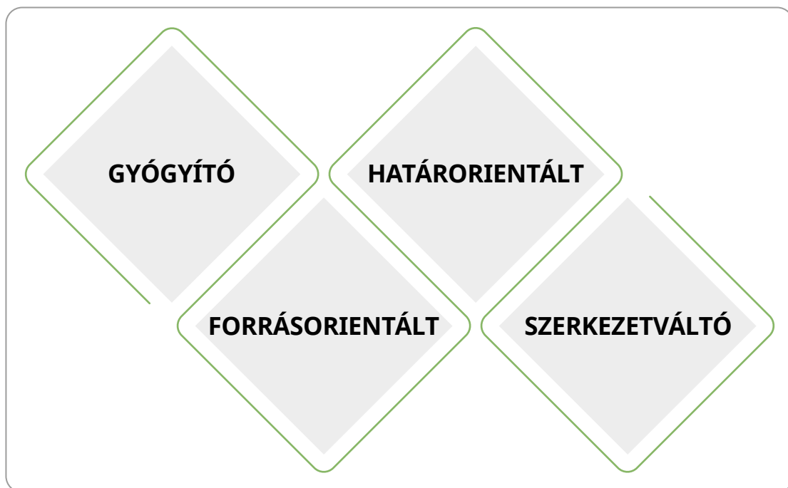
5.7 ábra A környezetpolitika típusai (saját szerkesztés, 2021)

A környezetvédelem területén megfogalmazott fő célok, alapelvek és a megvalósítás eszközszerrendszere, valamint a meghozott intézkedések. A lehetséges és hatékony környezetpolitikának a céloknak megfelelően többféle típusa van.