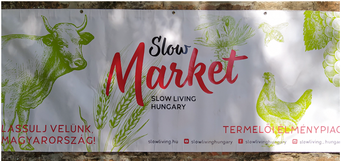
9.49 ábra Termelői élménypiac = Slow Market