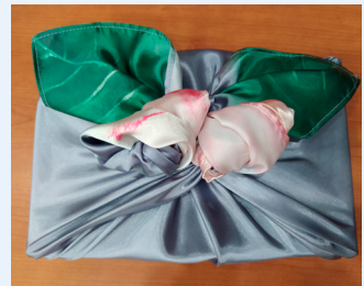
9.50 ábra Kukorica csuhéból babák és a Furoshiki kendőcsomagolás