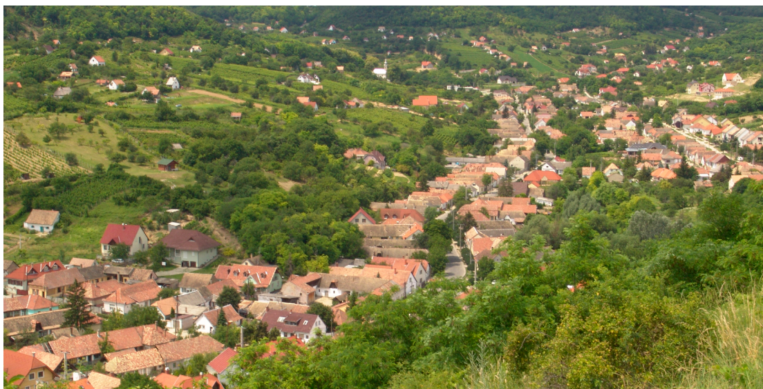
9.9 ábra Falusi környezet