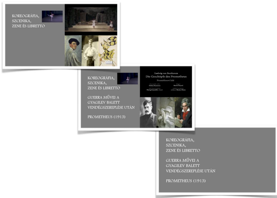
#prometheus1913 10 3. ábra

A 9. dia: az 1. és 2. szakaszban megegyezik, ebből két különböző fázist mutatunk, valamint a dia 3. szakaszban